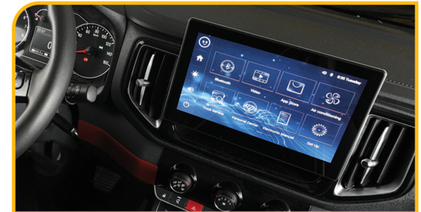
سیستم مولتی مدیا TFT لمسی (رادیو، رهیاب، بلوتوث، USB، SD)