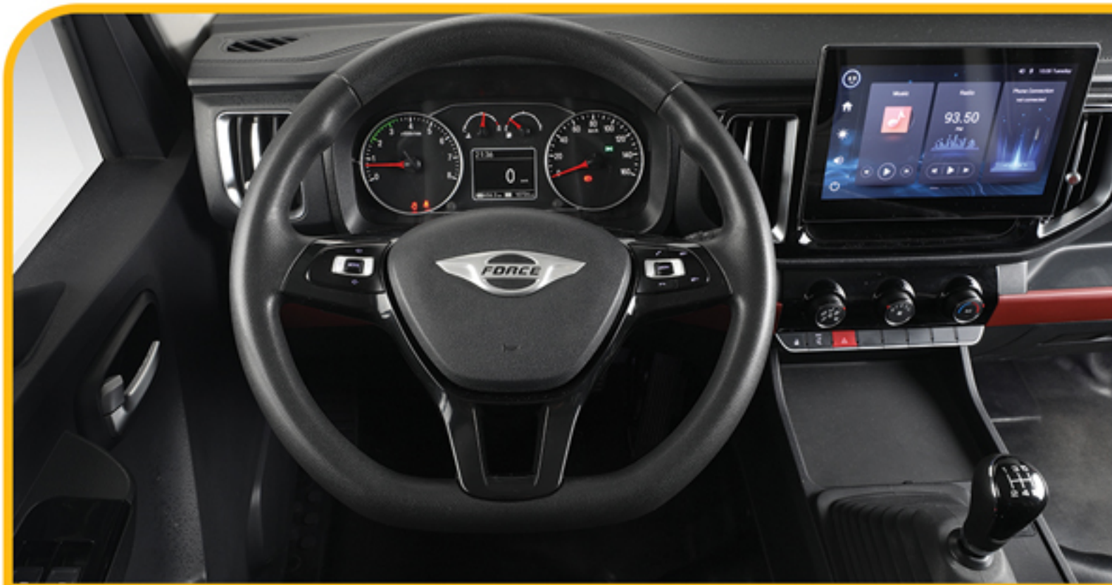
غریبک فرمان مجهز به کلیدهای دسترسی به مولتی مدیا و کروز کنترل