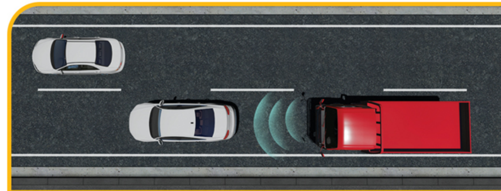
سیستم ترمز اضطراری خودکار (AEBS)