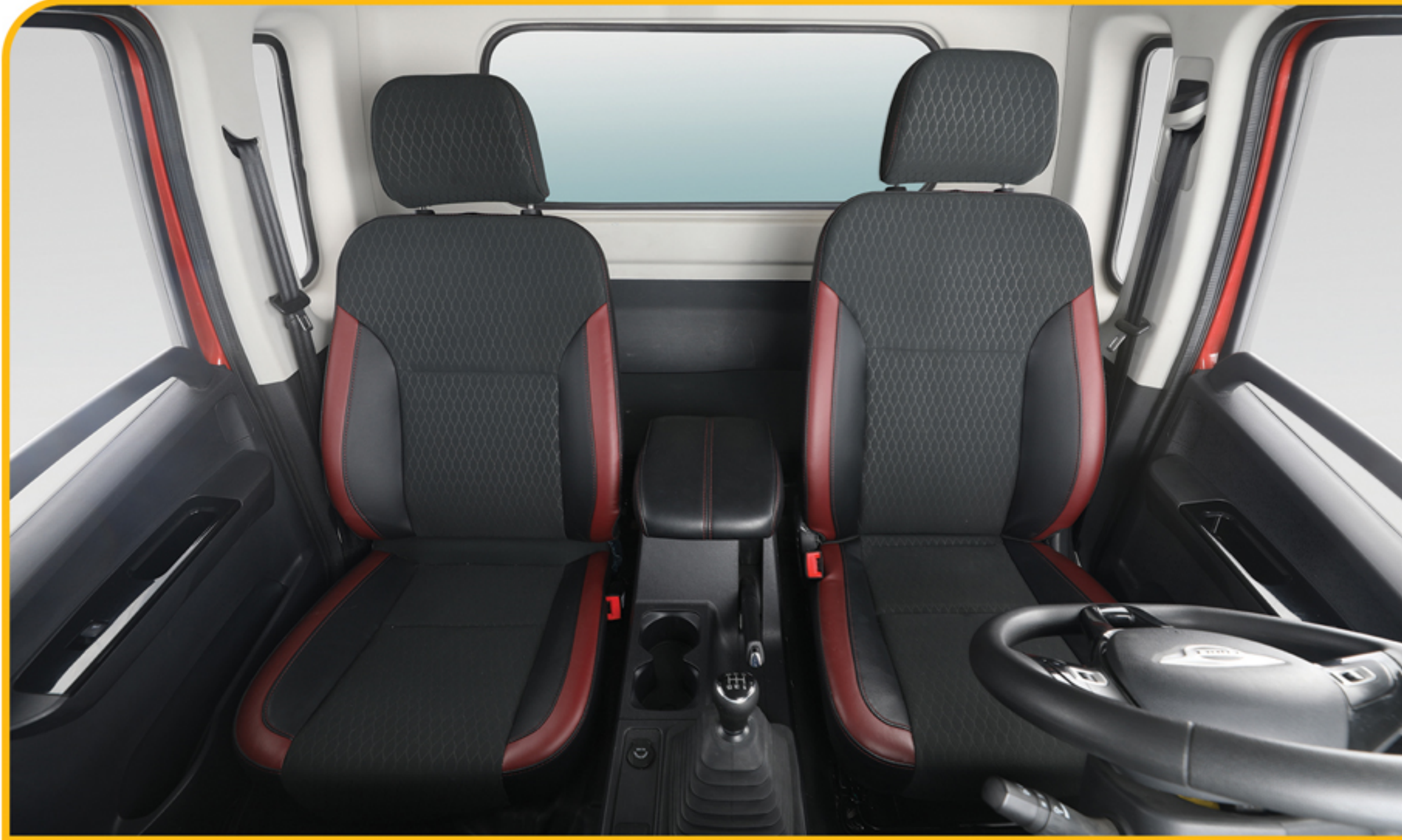
فضای پشت صندلی‌ها و کنسول میانی