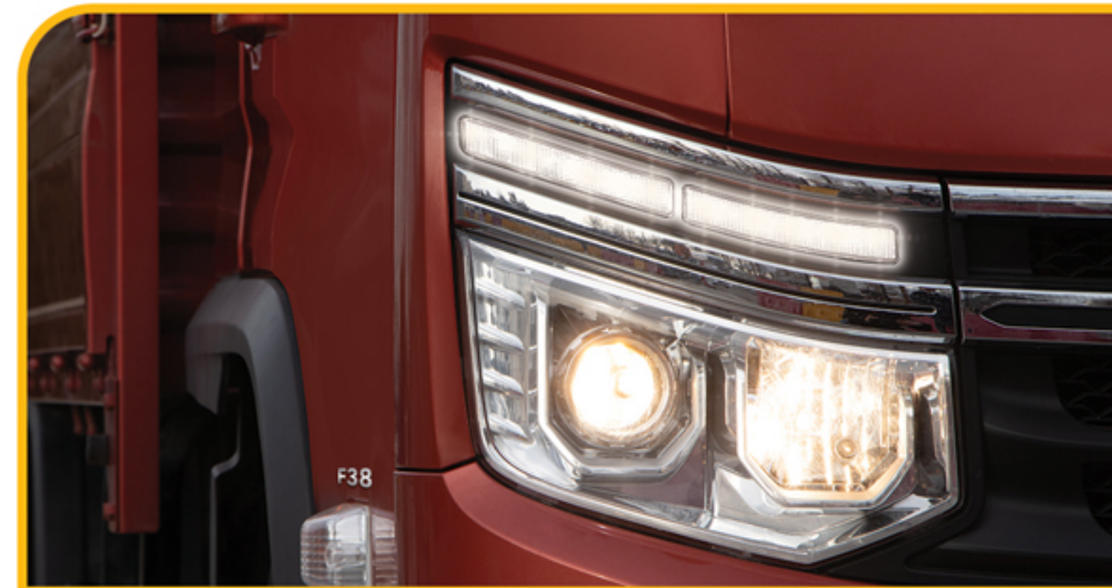
چراغ جلو با تکنولوژی PES به همراه چراغ رانندگی در روز LED