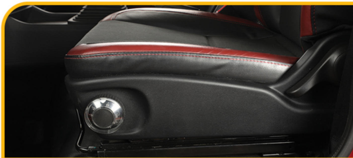
صندلی راننده با تعلیق مکانیکی و قابلیت تنظیم در ۶ جهت