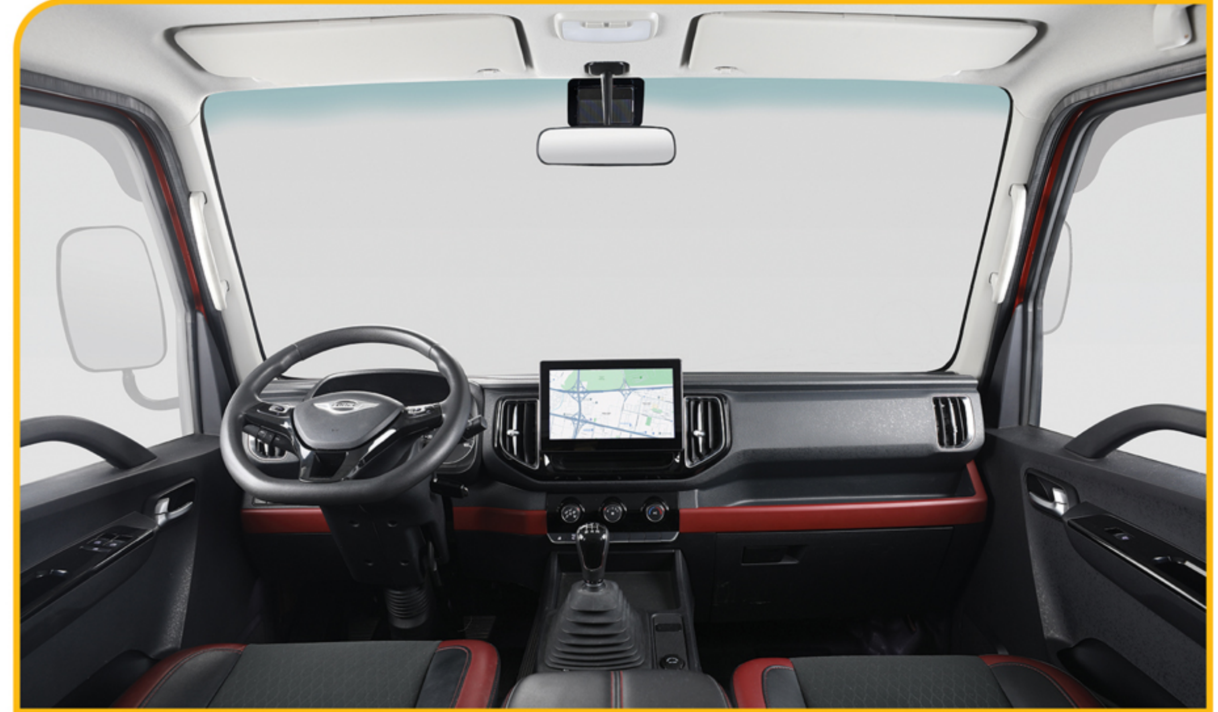
فضای راحت و به روز کابین