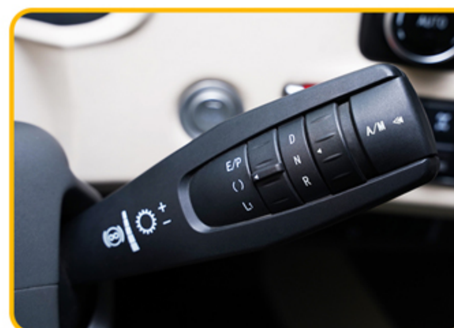
■ دسته تعویض دنده پشت فرمان