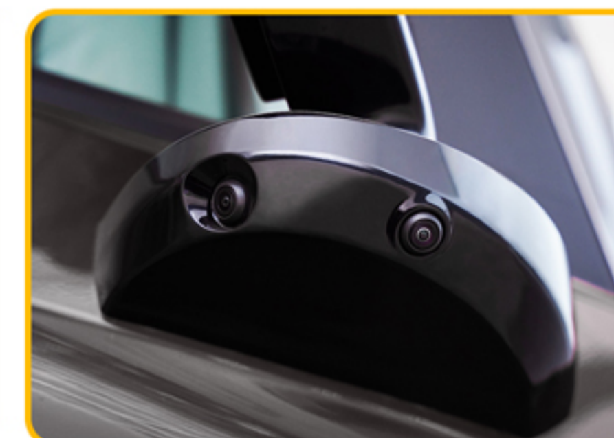
■ دوربین ۳۶۰ درجه