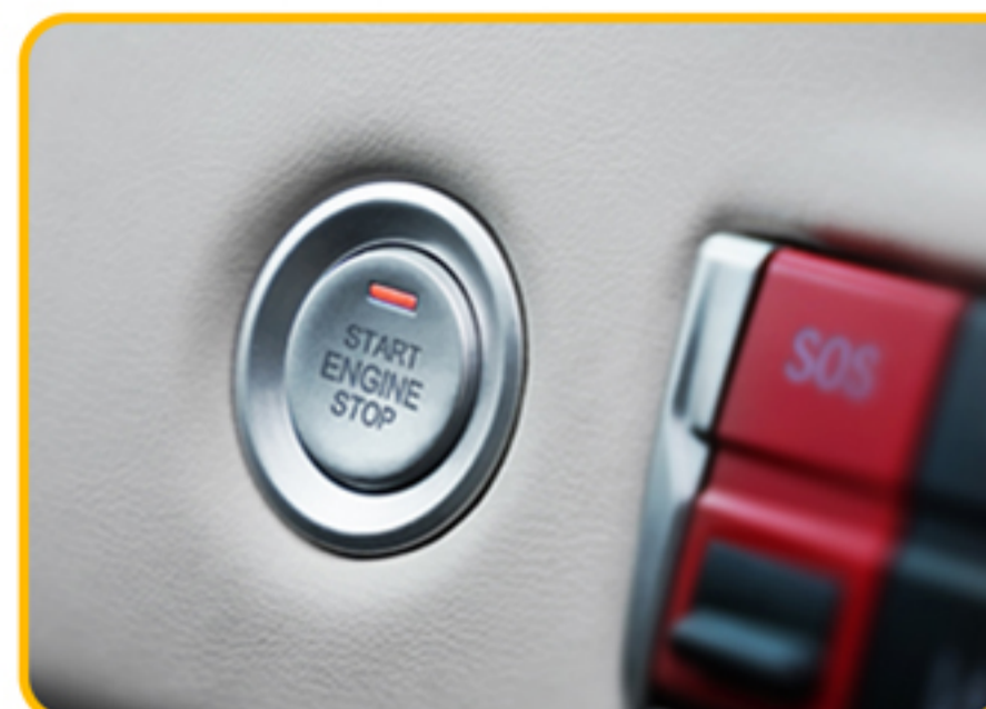
■ استارت دکمه‌ای (Keyless)