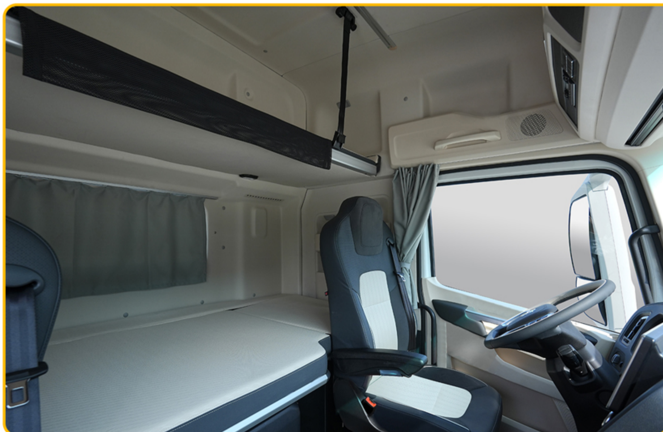
■ تخت خواب بزرگ