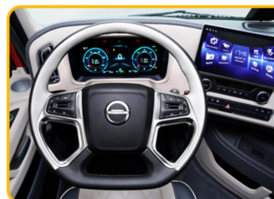
■ غربلیک فرمان مجهز به کلیدهای دسترسی به مولتی‌مدیا و کروز کنترل