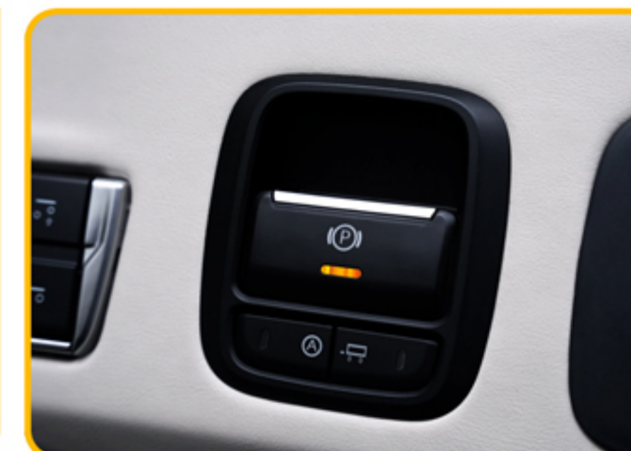
■ ترمز پارک برقی (EPB)