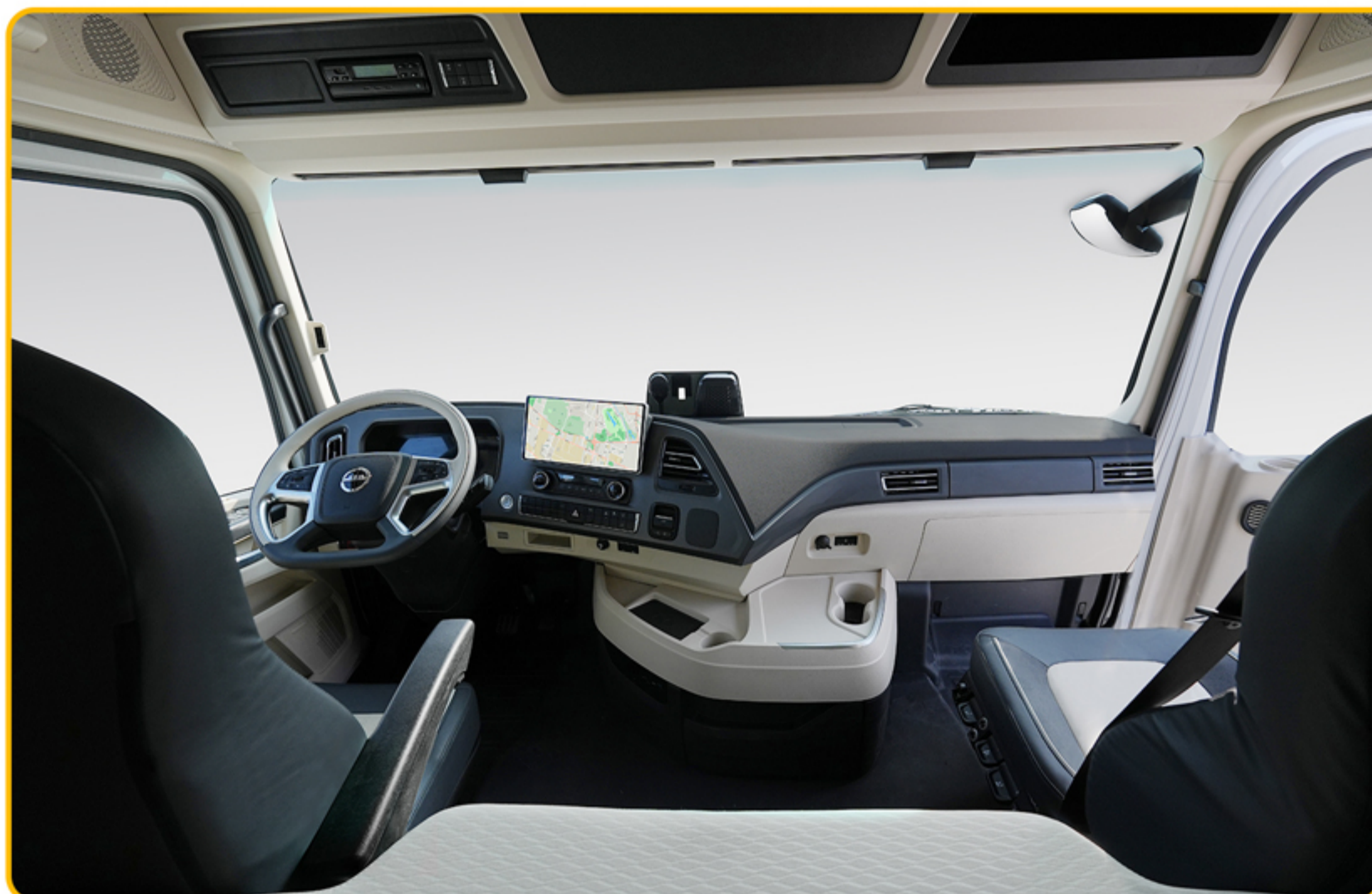
■ کابین بزرگ، ارگونومیک و مدرن به همراه سیستم مولتی‌مدیا ۱۲،۳ اینچی TFT لمسی (رادیو، رهیاب، بلوتوث، USB، SD Card)