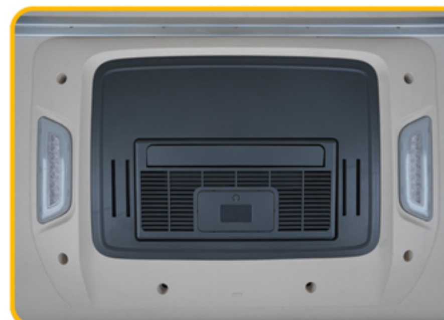
■ کولر درجا