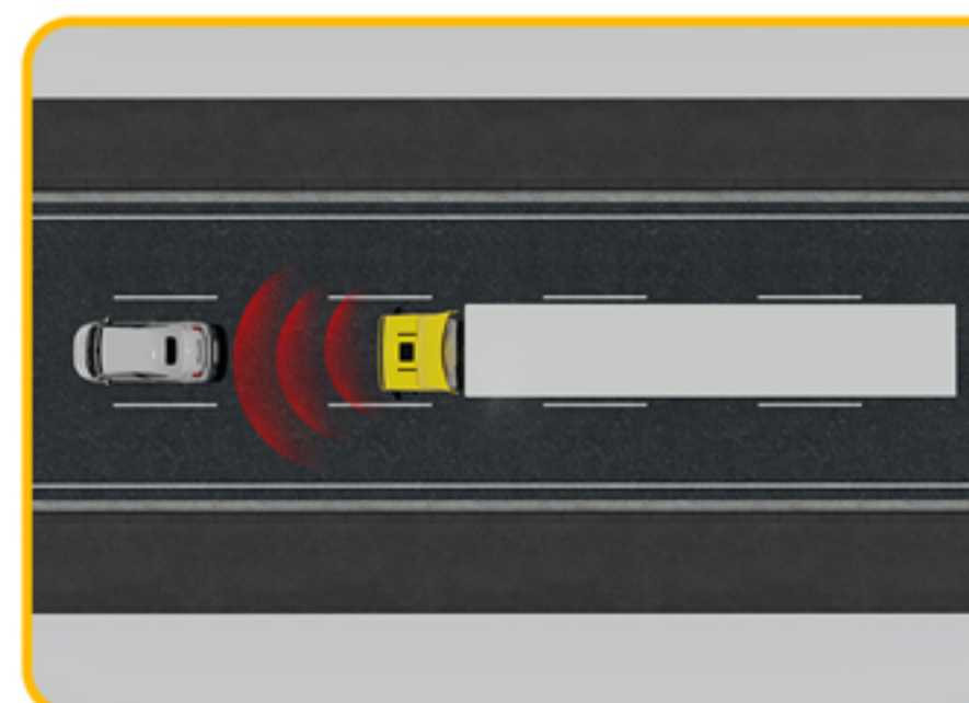
■ سیستم ترمز اضطراری هوشمند (AEBS)