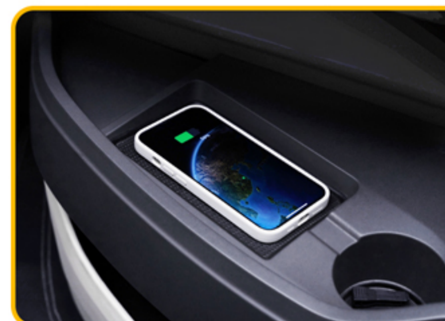
■ شارژر وایرلس