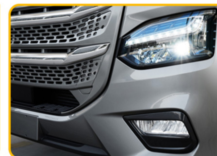
■ چراغ‌های جلو با تکنولوژی Full LED