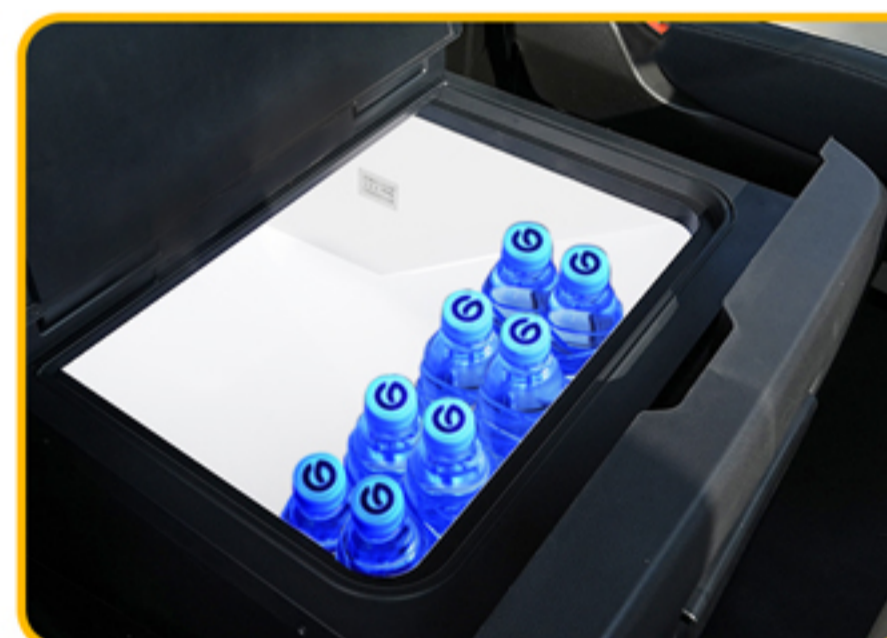
■ یخچال مسافرتی