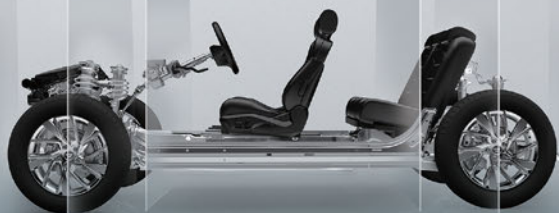
پلتفرم MQB فولکس واگن