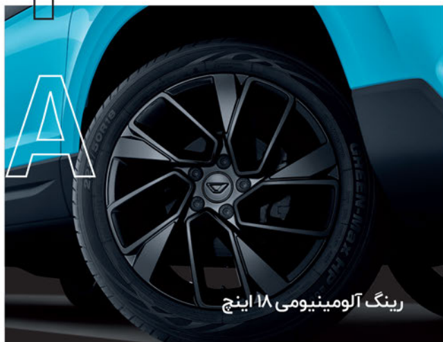
رینگ آلومینیومی ۱۸ اینچ