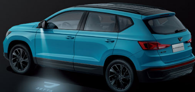
چراغ خوش آمدگویی